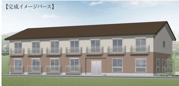
【完成イメージパース】